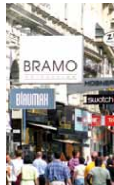
The ideal meeting point for

Der ideale Treffpunkt für Kreative und Trendsetter. Klamotten, Accessoires, CDs und Taschen. Alles, was das Herz begehrt, findet man hier auf einem Fleck. Wer mit dem Angebot dennoch nicht zufrieden ist, kann sich auch mal eben schnell die Haare schneiden lassen.