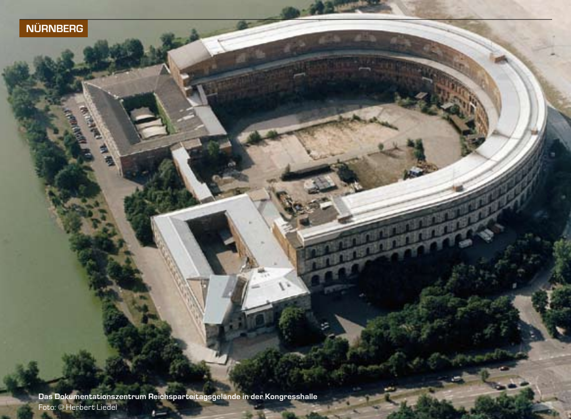
Das Dokumentationszentrum Reichsparteitagsgelände in der Kongresshalle